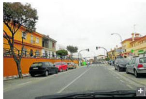
Entrada al núcleo de Guadiaro, en una imagen de archivo.