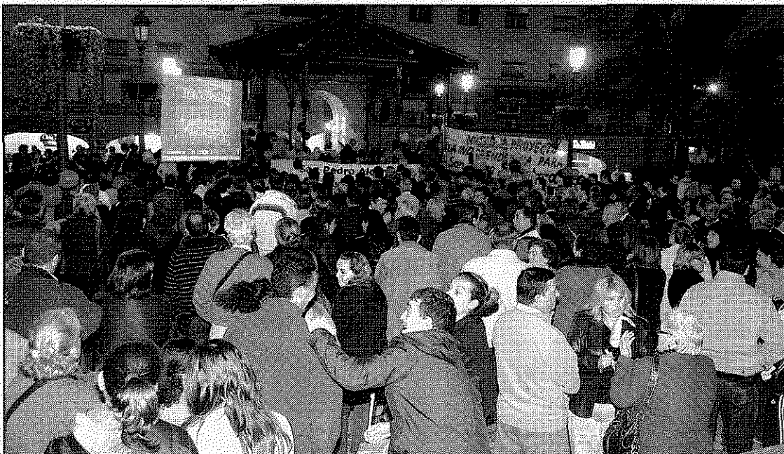
ISP valora positivamente la participación en las dos concentraciones, calificándolas como “un éxito”. A. G.

Así, a la espera de avances en alguno de los frentes que mantiene abiertos, ISP sigue desarrollando su tarea, informando a la ciudadanía y prestando especial atención a “otros ciudadanos que se han ido uniendo a San Pedro en estos últimos 15 años y que quizá no tienen una referencia clara de cuál es el movimiento independentista” que, de acuerdo con Fernández, “conforme van conociendo la situación se van adhiriendo” a la lucha por la independencia.