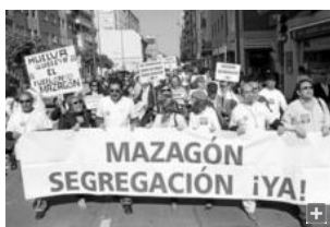
Una de las muchas manifestaciones que han respaldado los vecinos de Mazagón en favor de la segregación.

El polígono industrial Nuevo Puerto de Palos de la Frontera y las instalaciones portuarias de la capital son las principales barreras que tendrá que superar el colectivo vecinal Avema para alcanzar la segregación de Mazagón de los municipios matrices de Moguer y Palos. La sentencia del TSJA falló en contra de la segregación alegando que no existe una distancia mínima de 7.500 metros entre Mazagón y Palos, aunque reconoce que sí es un requisito que tiene luz verde en el caso de Moguer. El alto tribunal andaluz señala sobre el polígono Nuevo Puerto -perteneciente a Palos- que éste "se erige en obstáculo insalvable pues tratándose de suelo industrial, urbano por tanto, se halla a menos de 4.000 metros del núcleo principal de Mazagón". Y añade que "este polígono es el lugar en que se ubican las principales industrias del Polo Químico de Huelva, que ya era suelo urbano industrial consolidado en las normas subsidiarias de 22 de febrero de 1995".